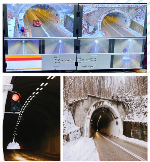
Slika 5 Tunel Dragoraj